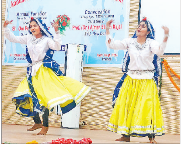
नारनौल। सांस्कृतिक कार्यक्रम प्रस्तुत करती छात्राएं।