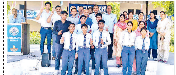
महेंद्रगढ़। खुशी जाहिर करते विद्यार्थी।