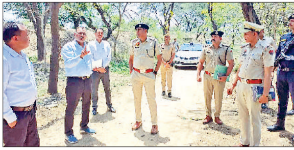
कनीना। बुवावास में घटनास्थल का निरीक्षण करते एसपी।