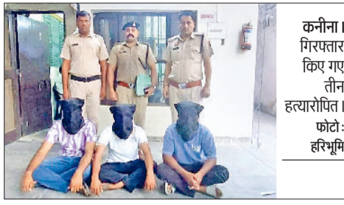
कनीना। गिरफ्तार किए गए तीन हत्यारानों।

साइबर सेल व थाना पुलिस टीमों का गठन किया, जो उनके संभावित ठिकानों पर दबिश दे रही है। वहीं इस हत्याकांड में महिला सम्पर्क की आशंका जताई जा रही है। पुलिस जांच के बाद ही पूरी तरह मामले का खुलासा होगा। बता दें कि गुढ़ा गांव के रहने वाले बैंक कर्म